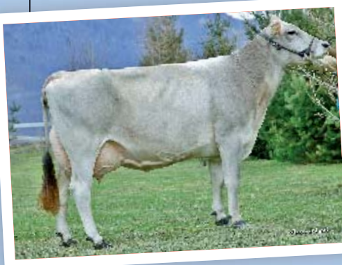
PHD-Tochter Chimera (EX93, Eu 96) aus Dotson Candy hat ø 3 La. 13.554 3,77 3,58. Ihr Eros-Sohn Chimeros ist bei Swissgenetics.

Hier ein ‚Besuch bei überragenden Kühen‘, die die Thomann-Herde geprägt haben. JB