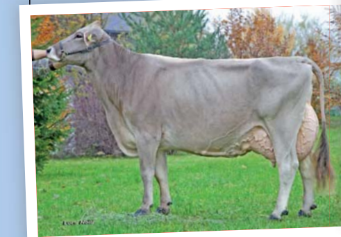
Jetway Anuschka (ø 4 La. 10673 3,74 3,48) ist eine Tochter von Starbuck-Arin. Anuschka ist mit EX 94 und Euter 96 bewertet.