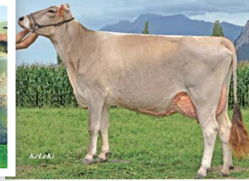
Rock'n-Roll Gina, Tochter von Impact Gilda. Von Gina (1. La. 10170 3,9 3,7) kommt Julen-Sohn Gino zu Select-Star in Prüfung.