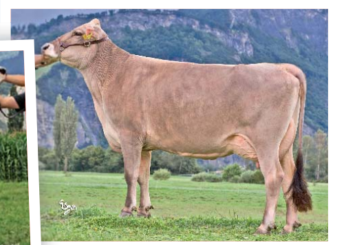
Denmark Dunya (1/83; 1. La. 9827 3,80 3,44) stammt aus der Familie von Starbuck Desiree. Dunaj war Reserve-Eutersiegerin an der Revue 2006.