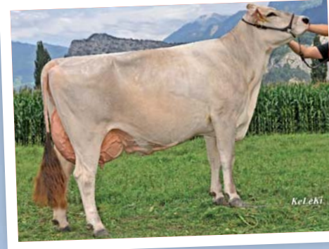
Die Gordon-Tochter Granada (MV: Nortan) mit einer Bewertung von VG88 sowie 9862 4,4 3,9 in der 1. Laktation. Thomann: „Diese Kuh verkörpert den idealen Typ.“