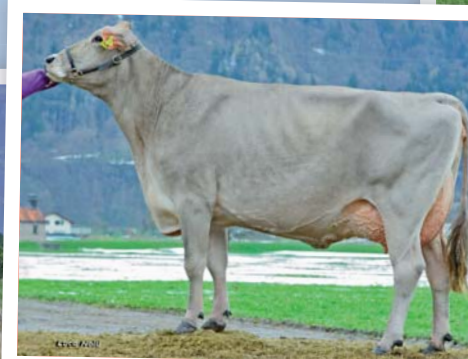
Kongo-Tochter Whitney EX94 (ø 3 La. 9622 3,96 3,63) geht über Starbuck und Jargon auf Beautician Waldi zurück.