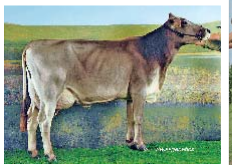
Über Jahre der Star im Stall Thomann und eine Kuh mit vielen Schauerfolgen ist Impact Gilda (EX 96/Euter 98) mit ø 4 La. 10913 4,27 3,79.