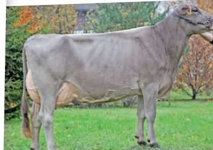
Camelot Cindi aus der Acevio-Familie: EX 90 (ø 2 La. 10892 3,95 3,53) mit EX 91 im Euter.