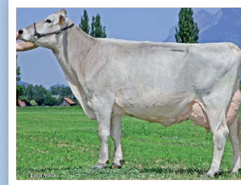
Ragaz Norma EX95/ Eu 95 (MV: Eusebio) mit ø 4 La. 8229 3,94 3,49.